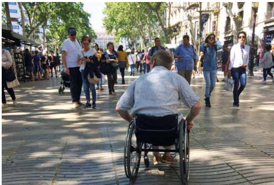
Här ser man hur det ser ut på en del av deras stora gågata LaRambla. Det var perfekt att rulla där med många restauranger och mycket att titta på.

Något jag tycker att man inte skall missa är att vandra runt bland kvarteren och bara njuta av stämningen. Det är mycket vackert. Man bör även besöka den speciella kyrkan Sagrada Família, en kyrka som började byggas i slutet på 1800-talet och som fortfarande inte är klar. Det var väldigt fascinerande, arkitekten Antoni Gaudí hade verkligen en tanke med alla detaljer som han byggde. Att han även var fullt medveten om att han inte skulle kunna bygga klart kyrkan under sin livstid, och därmed fick bygga så att nästa generation skulle kunna fortsätta, visade även det att han verkligen planerade detta mycket noga. När du är här, rekommenderar jag varmt att du unnar dig en så kallad audioguide. Då får du reda på detaljer som du förmodligen aldrig hade kunnat gissa dig till. Det är helt klart värt den extra kostnaden.