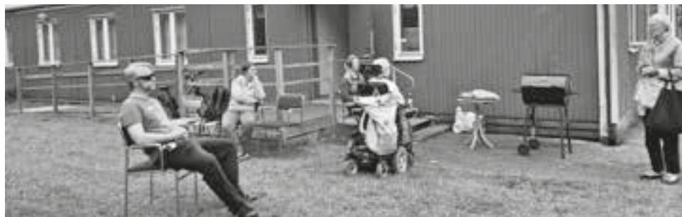
DHRG:s föreningsmöte på Välen

Viljans IF har haft all sin egen verksamhet förlagd till Välen. Likaså Viljans sponsor, DHR Göteborg,