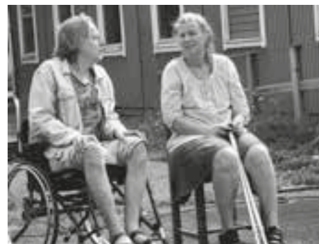
Utomhusföreställning Teater Kattma

DHR Göteborgsavdelningen har lånat lokalen vid 2 tillfällen. Ett möte med nätverket "Öppna Göteborg" samt ett föreningsmöte. Teater Kattma har också under hösten haft sina 3 repetitioner i lokalen.