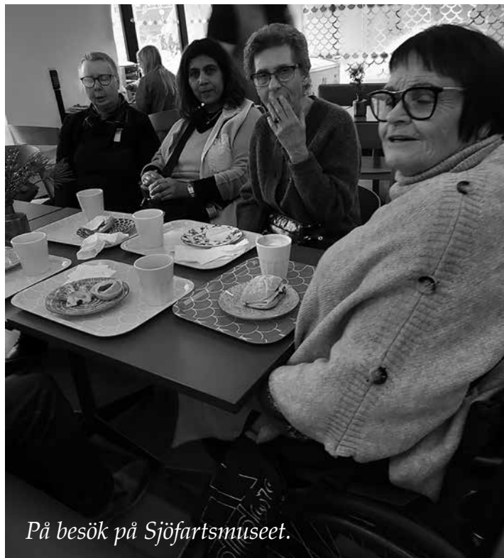
På besök på Sjöfartsmuseet.