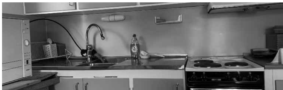
Ordning och reda på Välen

Boccia Styrelsen bevakar Kortspel Styrelsen bevakar Mattcurling Styrelsen bevakar