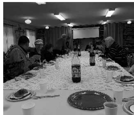
Viljans IF:s påskfirande

Vi har genomfört en sedvanlig rensning i lokalen. Onödiga och söndriga saker har rensats bort.