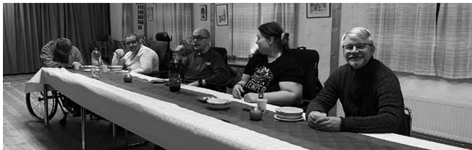
Julgröt med film på Välen

Styrelsen vill härmed avge en redogörelse för Viljans IF:s verksamhet under det gångna året. Efter årsmötet, som hölls den 3 mars 2024 har styrelsen, revisorer, grenledare och kommittéer bestått av följande personer: