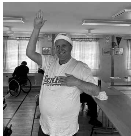
"Sällskapsrese-maraton! Fem filmer på raken!"

Lokalen har hyrts ut till medlemmar vid 1 tillfälle och till Hjärnkraft Göteborg vid ett annat.