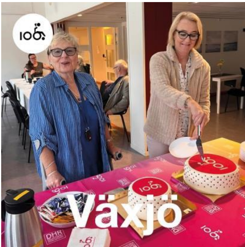
Tort kallaset i Växjö