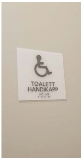
Foto till vänster: En skylt på en toalett - rullstolssymbol och under texten "Toalett Handikapp" därunder punktskrift.

Foto till höger: Enkelt åtgär- dade hinder - Skylt med en pil (hänvisar till andra sidan), under sitter en rullstolssymbol och barnvagnssymbol. Före skylten ett räcke på tvären framför en trottoarkant.