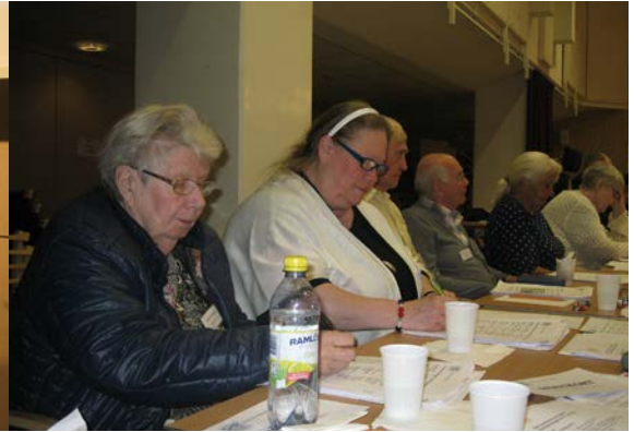
Foto: Sex avdelningsombud vid årsmötet sitter och skriver. På bordet framför dem syns papper, en petflaska och plastmuggar.

“ Vårdplanering ” och ansåg andra att-satsen besvarad. När det gäller motionen om “ Rullstolstaxi ” ansågs första och andra att-satsen besvarade och tredje att-satsen bifölls. (Mer om vad som hänt under året i dessa områden kan du läsa om under respektive samverkansråd).