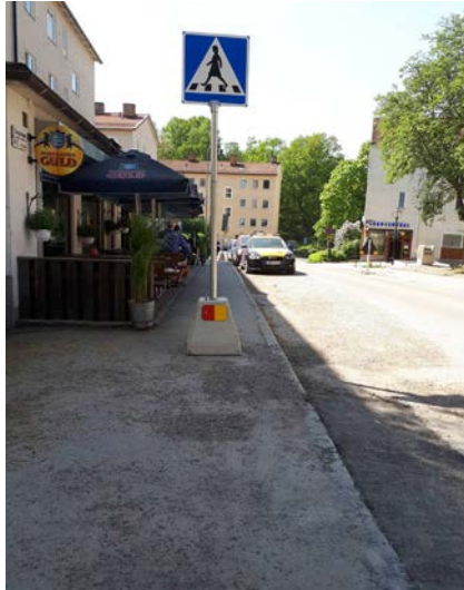
Foto till vänster: Enkelt åtgärdat hinder - En uteservering och sen en övergångsstäl- leskylt mitt på trotto- aren.

Foto till höger: Enkelt åtgärdat hinder - En uteservering och sen en övergångsstäl- leskylt mitt på trotto- aren.