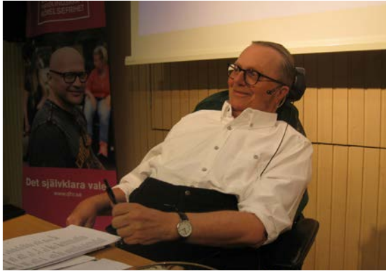
Foto: Jaan Kaur sitter vid podiet med en penna i handen, headset och en DHR-banderoll bakom. Papper syns på bordet.