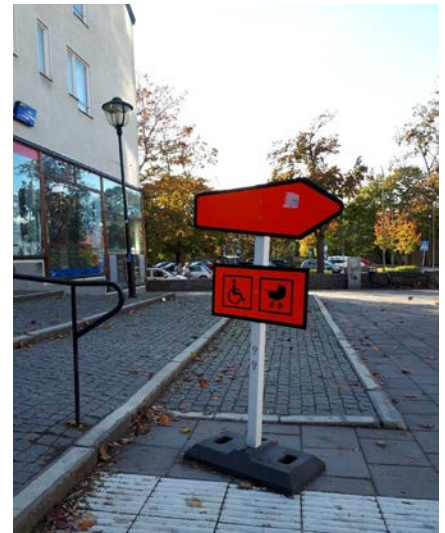
Foto till höger: Enkelt åtgär- dade hinder - Skylt med en pil (hänvisar till andra sidan), under sitter en rullstolssymbol och barnvagnssymbol. Före skylten ett räcke på tvären framför en trottoarkant.

En Insiktsutbildning hölls under våren för ett tiotal medarbetare inom Hälso- och Sjukvårdsförvaltningen . Förvaltningens mål är att 90 personer/år ska genomgå en insiktsutbildning men på grund av flytt för förvaltningen hölls utbildning vid endast ett tillfälle. Där medverkade vi tillsammans med distriktsorganisationerna SRF och Funktionsrätt.